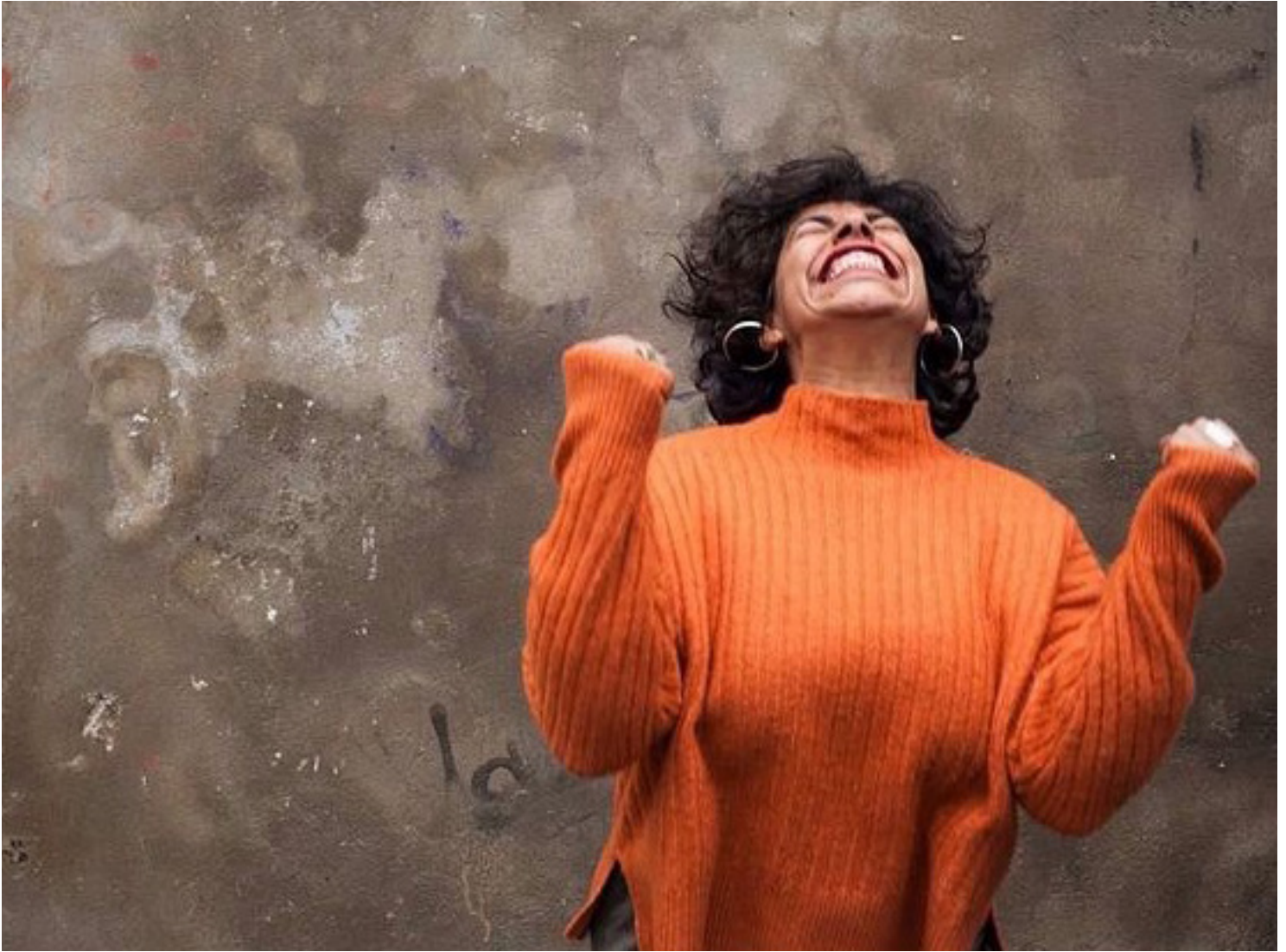
Oeuvre de Morgane Visconti