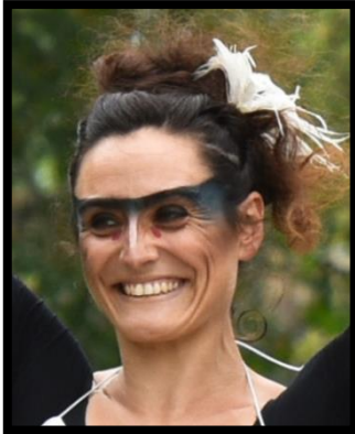
CORETTA ASSIE Comédienne